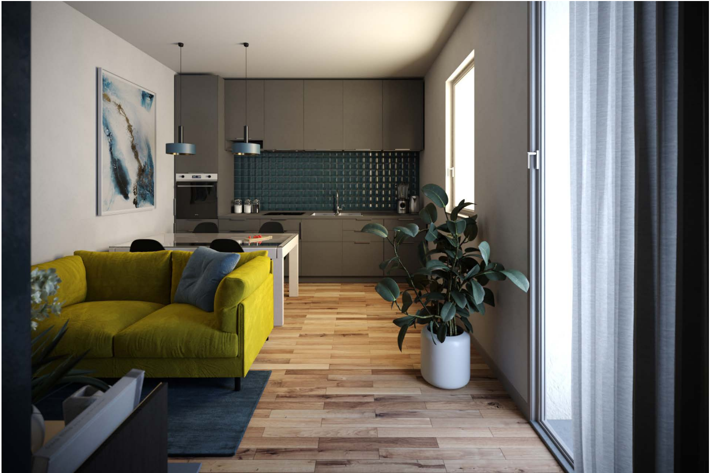
Kitchenette and Living Room