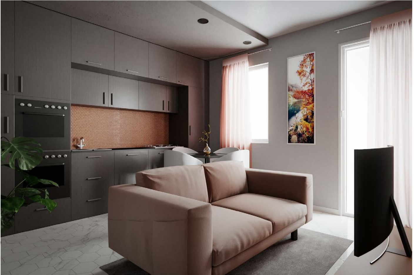
Kitchenette and Livingroom