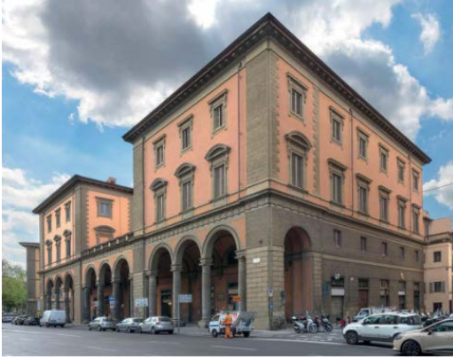
Palazzo Libert' e' un imponente edificio ad angolo tra l'omonima piazza e via San Gallo. Ospita attivita' commerciali al piano terra e residenze ai piani superiori.