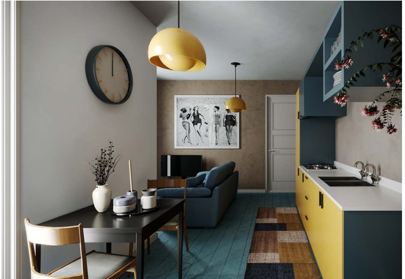
Kitchenette and Livingroom