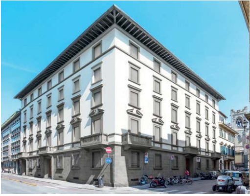
Intervento in centro storico a Firenze: Lussuoso appartamento meravigliosamente arredato e studiato nei minimi particolari per avere il massimo confort.